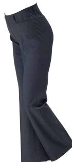
20ブラック 【待望の黒入荷】

W切り替えでおしりがすっきりみえて、 ポケットなしなので座った時のごわつき感ありません。